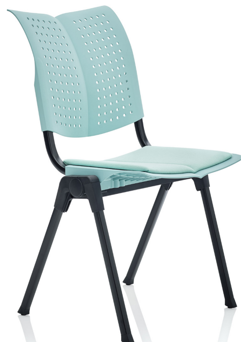
Design: Peter Opsvik. Patent- og designbeskyttet.