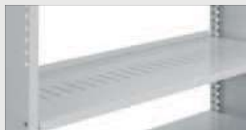
Hylle for skilleplater