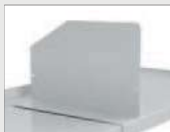
Bokstøtte for plan hylle