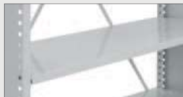
Plan hylle (maksbelastning 75 eller 150 kg)