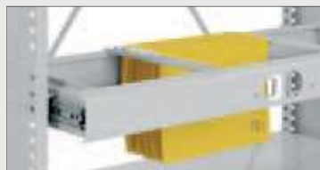
Uttrekkramme for hengemapper