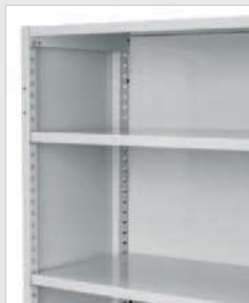
Tett rygg til arkivreol

Et meget solid og funksjonelt hyllesystem for oppbevaring av arkivpermer, kontorutstyr, papir, rekvisita osv. Gjennom stor variasjon av hylledybder, kapasitet og tilvalg sikres optimal utnyttelse av lagerrommet - tilpasset ditt behov. I de ferdige definerte grunn- og følgefagene har hyllene en lastegrense på 75 kg, tilfredsstillende for å få orden på de fleste lagerbehov.